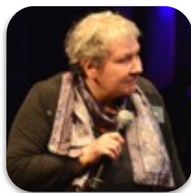
Foto impressie PETS 14 maart 2015

Stadsschouwburg Sittard..... een uiterst geslaagde bijeenkomst