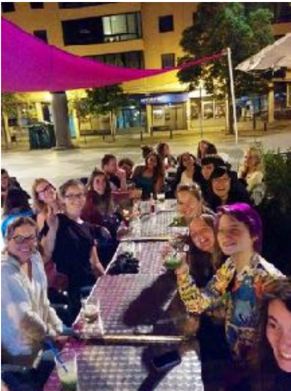
Vorige pagina en links: Zomerkamp in Italië Foto beneden: Zomerkamp Egypte